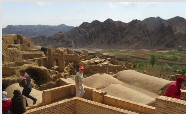
Un Pays de montagnes