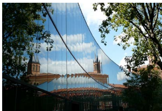
Muséum Histoire Naturelle