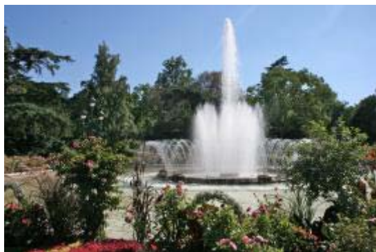
Le Jardin Botanique

Départ de La Rochelle à 6h00 en direction de Toulouse. Arrêt petit déjeuner en cours de route. Arrivée à Toulouse, déjeuner au restaurant le Moai situé dans l'enceinte du Muséum d'Histoire Naturelle. Puis visite du Muséum, découverte guidée de l'exposition temporaire et permanente des objets spécifiques du Muséum. Vous terminerez votre visite par le jardin botanique Henri Gaussen. Transfert ensuite à votre hôtel. Installation et temps libre avant le diner. Nuit à l'hôtel.